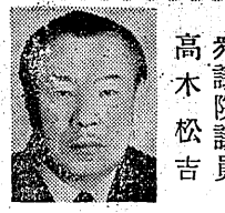
衆議院議員 高木 松吉