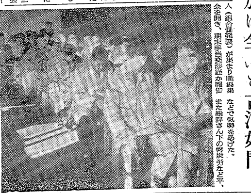
掛声だけの統一行動 参加は全くと古河好間