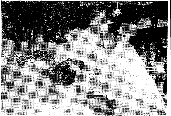
再三の大火憂え田町で盛大に厄払い。田町の大火を憂える中、盛大な厄払いが行われた。

「教育研究の場」誕生平市 分庁舎二階に設置。平市の分庁舎二階に「教育研究の場」が誕生。平市の分庁舎二階に「教育研究の場」が誕生。