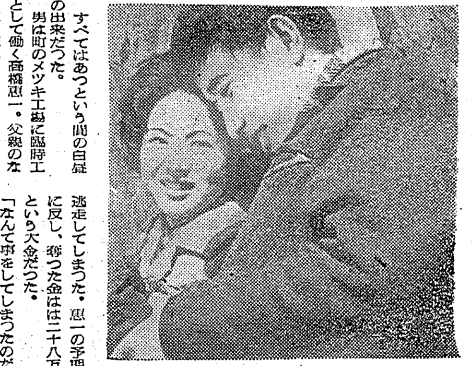
Illustration of a woman's face.