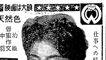
Portrait of a woman.