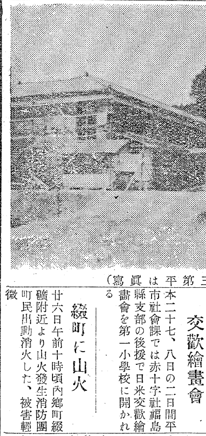
(寫眞は平市第三中學校全景)