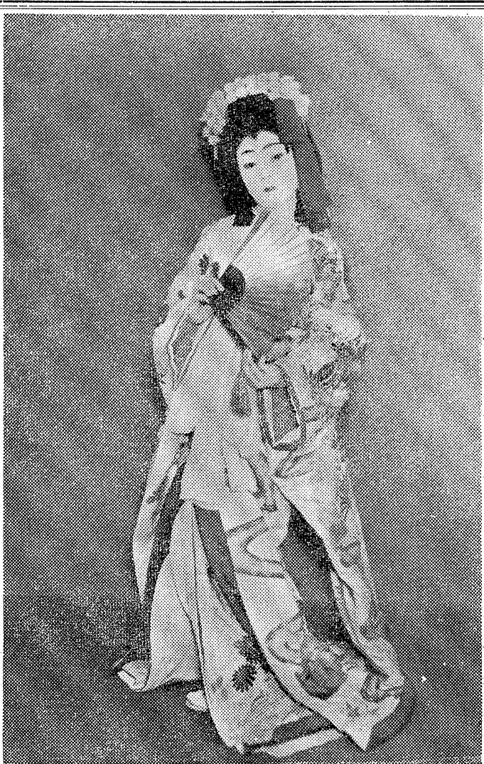
磐城市下町二、東小学校五年生、十一才、小學校一年の時、花柳舞臺和さんとの門に入り、以来五年になる。初舞台の「手習い子」で、くま子「チャンキリ節」などがよく好きだ。いま新年会に踊るものを探しているが、「子守」のような赤い坊を背おった踊りをぜひ踊りたいといっている。

エド多摩地方谷松松坂さん三三三は、死体検視の結果、舌が折れている。内郷市は、磐城市をまわって、磐城市の敷地をめぐって、二市に決定した。