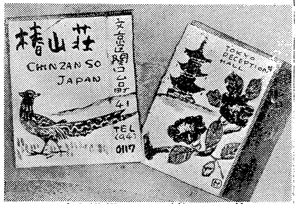
椿山荘 25 マッチの横顔