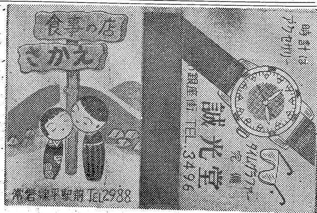
マツチの横顔 誠光堂 さかえ