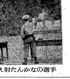
写真=ピストルを構え射たんかなの選手

浜通り警察連絡協議会主催の浜通り各署対抗射撃大会がきょう午前十時から平市合川溪の射撃場で行われた。