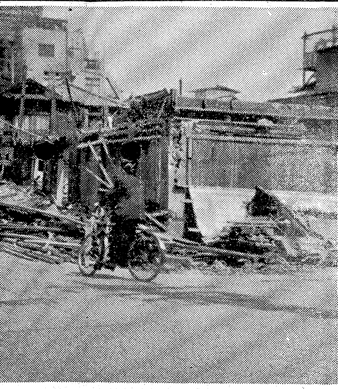
解体作業を終る平母店敷地