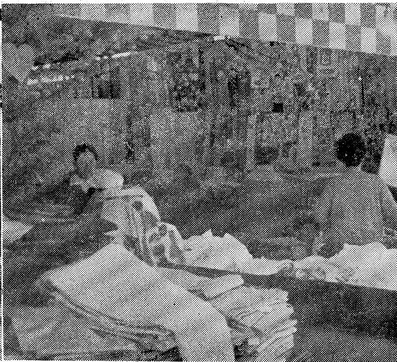
大黒屋での買物は平本店に集中されている