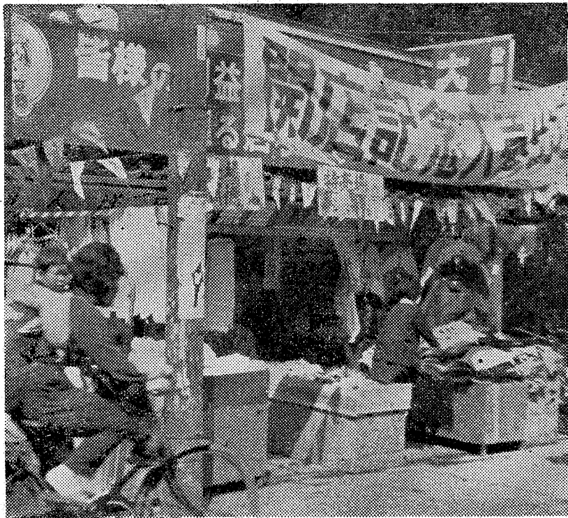
中央通りに新しく特売場ができた