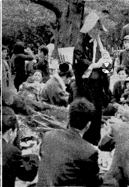
流し芸人の尺八に合わせ南園土佐を