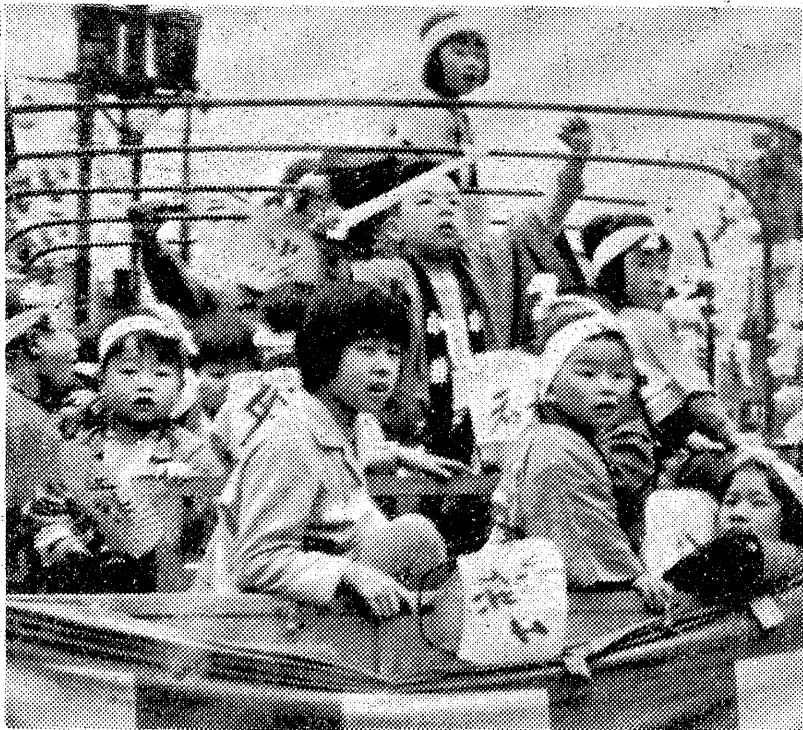
サア元気に出発しようと思小若さん