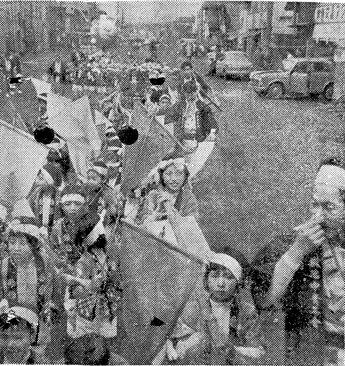
ワツシヨイ、ワツシヨイ長蛇の列