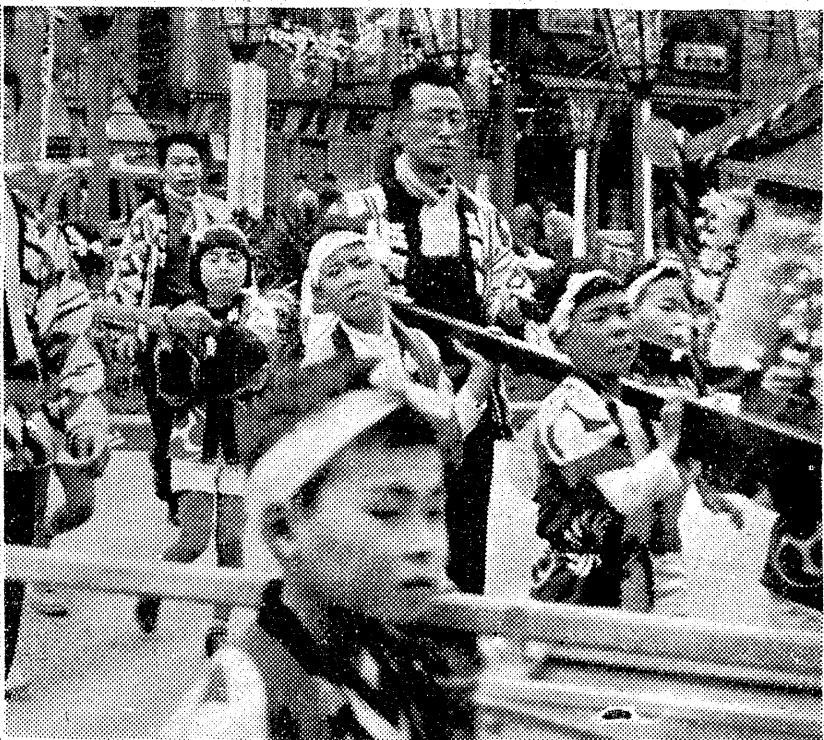
もうそろそろくたびれてしまいました