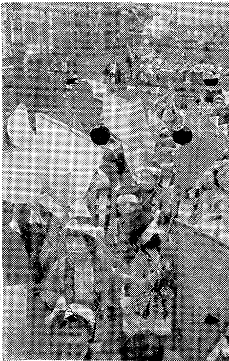
ワツシヨイ、ワツシヨイ長蛇の