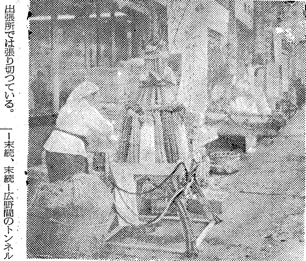
藤越の野菜の東京タワ―。お正月の買物客でにぎわう平市の商店街に野菜づくた東京タワ―が目を引く。市民の人気を呼んでいる。この野菜のタワ―は銀座の藤越が「ボウ、ネギ、ニンジン、カブ」などを組合わせてつくったもので高さ約四尺あり、ソックリ買えばサツト一万円という豪華版。このほか丸青市場から船出した「その宝船が野菜を満載して店頭に飾りつけられ、これまた一そのお値段一万五円で買物の市民たちも目を惹いていた。【写真：東京タワ―】

国際貿易港として発展を続ける本町の外航船の出足は好調。この分では六十隻の新記録を立てた昨年を上回る七、八十隻の入港は確実と横浜税関小名浜支署の調査。