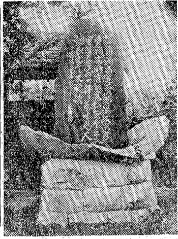
碑の筆生先湖東田藤

隠れた温泉地又は隠れた緑滴る如き山岳を背景にし遊覧など紹介されるところ東南一帯は果てし盡きざるがかなりあるが、然しその山間にして鬱然として樹林等のうちでも隠分世に出ての密生する鬱を控へ春は四等紹介しようと思ふ所も吹く時、鶯來りて春を讀或は見方によつては「なんへ夏は雨降らざるも冷風満だあそこか」と云はれるかちて暑さ知らず秋は遠山のも知れない、而も鐵道省發紅葉寝ながらにして詩趣を行の「温泉案内」には立派を、自然美に恵まれそな寫真まで載つてゐる。れから見ても全く俗化されこの點に於ては實によく紹ない、淳朴ない、養生地で