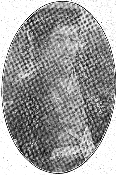
郎四睦平大長町來勿