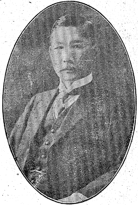
郎三重島安長村田山