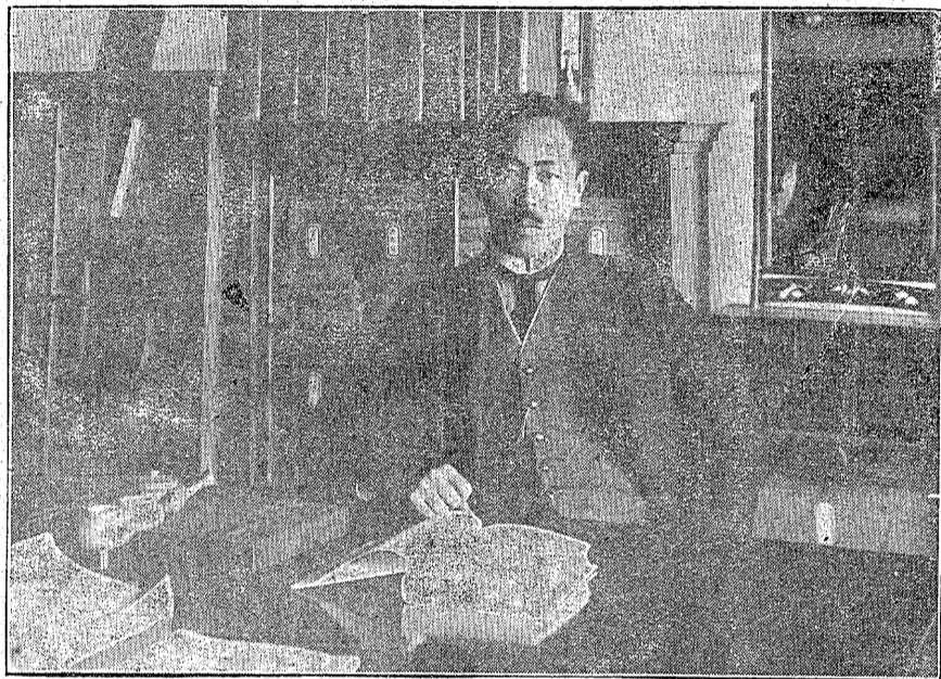
則正田柴 長校學小等常尋崎磐