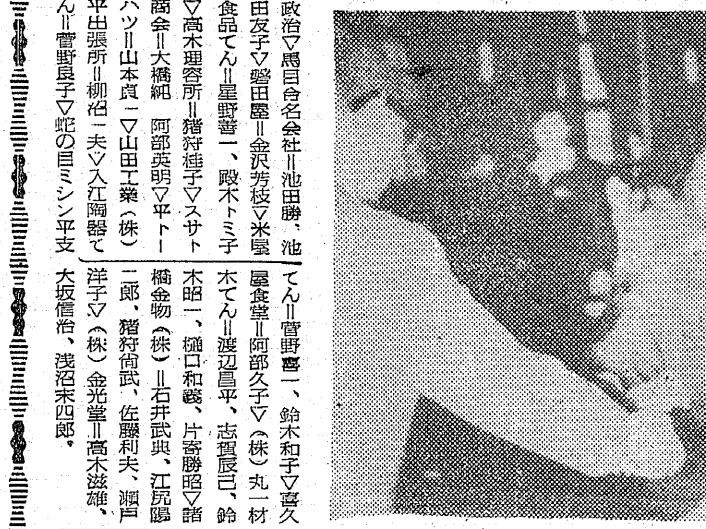
事件現場で捜査する警察官たち。