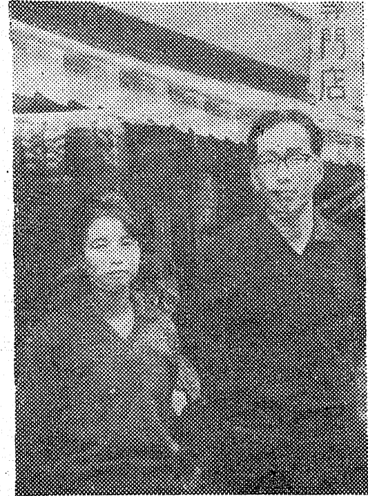
糸類・ボタン・手芸品の店 平市銀座通り電四三六