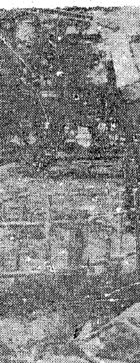
遺族涙もあらたに

ストを一時中止。日本水素で闘争再開。ストは一時中止された。日本水素で闘争再開された。ストは一時中止された。日本水素で闘争再開された。