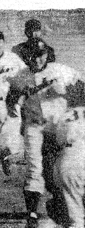
観衆一投一打に熱狂

国鉄大毎戦は、昭和三十七年に開始された。昭和三十八年、国鉄大毎戦が完了した。昭和三十九年、国鉄大毎戦が完了した。昭和四十一年、国鉄大毎戦が完了した。