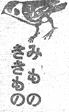
ききもの 五半 提供 50分