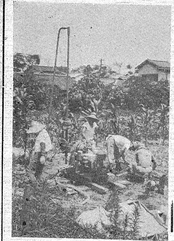
【写真】平城のボーリング調査

第十一回磐城市民体育祭が、廿六日(土)午前九時から小好間村を以て残る市町村も答申する会議をもつことになったが、先きは開いた四倉町協議会の議場で、田入村で開いた町協議会は四十一日三月までに合併を申し合せたことが判明された。八カ町村が打ち出したこの線に対し五市はこのような手を打ち出すか、町村側の意見と一致すれば一年八月月後となる。