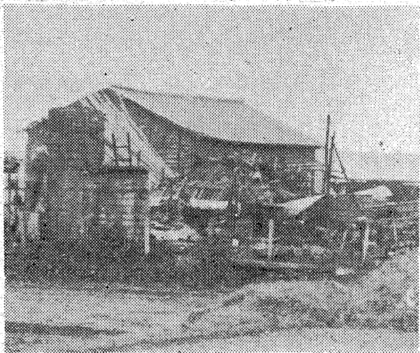
六日前警時四十五分の内郷市 級町川原田四三、燃料製造業田村