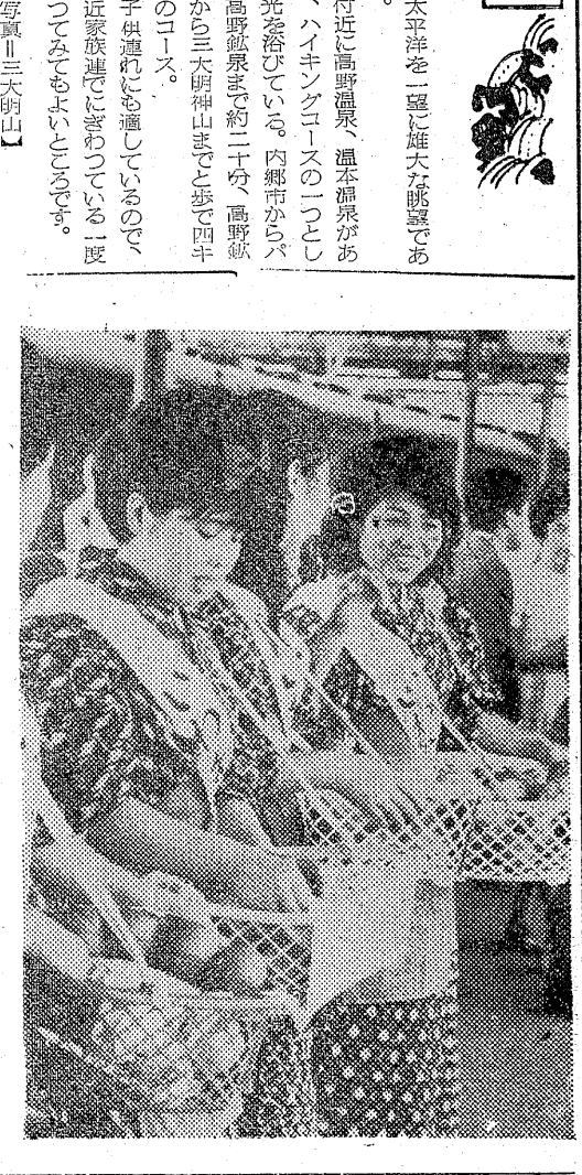
梨娘売切れ 梨の平均90個 九月二十日から一週間平野ホーンに安売された。梨娘は二十六日午後四時五分「はつきり」を最後にPRを終了した。一週間の総売り上げは六百二十個、一日平均九十個売れており、昨年は三十八日間で総売り上げが六百三十個。来年は予定数まではいかねたが、同光製ではPRに相当の効果があつたとみている。来年は今年に倍増しようとお考え。

狩猟解禁日は十一月一日からで、平市事務所では十一月一日から受付している。昨年は受付日四十四人であったが、今年はこれを上回る予想である。