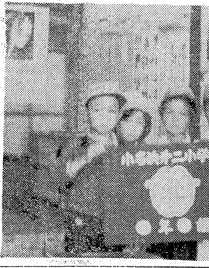
【写真】小名浜二小の組旗。組旗は枚数を中央に配し、下部に学年、組名が染め抜いてあり、

警備市小名浜二小(三瓶のり)校長千七百(り)と青赤黄とを数種に分けた各クラスの組旗を