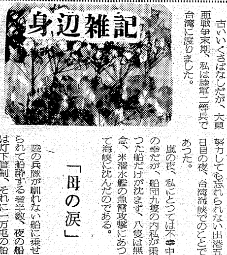
身辺雑記... 昭和二十一年、私は...