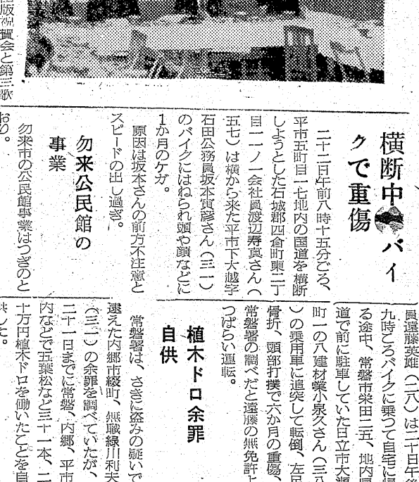
合唱熱盛り上げの4月石城連盟発足式の様子...

平市正月町一九 電話七二四一三 三菱重工建設機械代理店 西独製才ベル代理店 スプイデー自動車商会