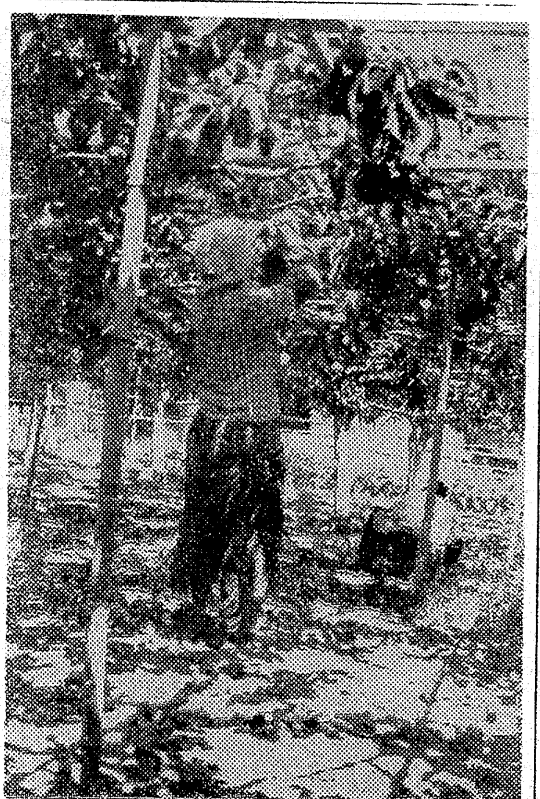
【写真】最後の手入れに大わらわの主婦たち

「日本の長い日」 河野 学 国民の胸に刻まねばならぬ。何かに目覚め、耳にされた人もある。何かに目覚め、耳にされた人もある。何かに目覚め、耳にされた人もある。