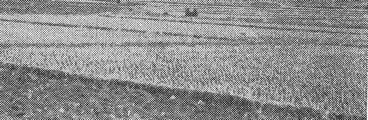
【写真】炭酸職業者用アパート

二人とも東京の人で一人は国立大学三年、一人は高校卒、目下浪人中の身である。二人とも共通して化粧もな、スカートにあつたドレスを着て真面目な態度であつた。暑い昼日中リヤカーをひいて歩きまわつたせいか、日焼けした肌が多少つれ気味だつた。