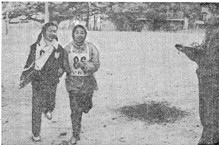
ゴールイン ポイントでは二人がいきよに行動しなければダメ 一人が上位にくい込みながら他が遅れたため下位になったチームもある

○...暗く明るく元気な子供を育てよう、常警公民館は地区子供代表のジュニアリーダーが学校オリエンテーリングを二十日、平ユースホテルで開いた。参加者は男女児童十三人、公民館と市教委職員五人の計十八人。 ○オリエンテーリングは地図と磁石、コンパスを頼りにコースに設置した五つのポストを通過、ゴールまでのタイムを競うスポーツ。この日は児童対象なので、隣町の團塊センター付近折り返し五・五時、規定時間一時間半の特別コースを設定。市教委松本係長から基礎知識を受けた後、二人ひと組のポイントのコースを二時半、平ユースホテルスタートした。 ○...が子供会のリーダー連、特別参加でウロウロの大人をのり目にカンと地図、コンパスをフル活用。一位は一時間十二分でゴールし、頭脳と体力を使うオリエンテーリングを十分に満喫していた。