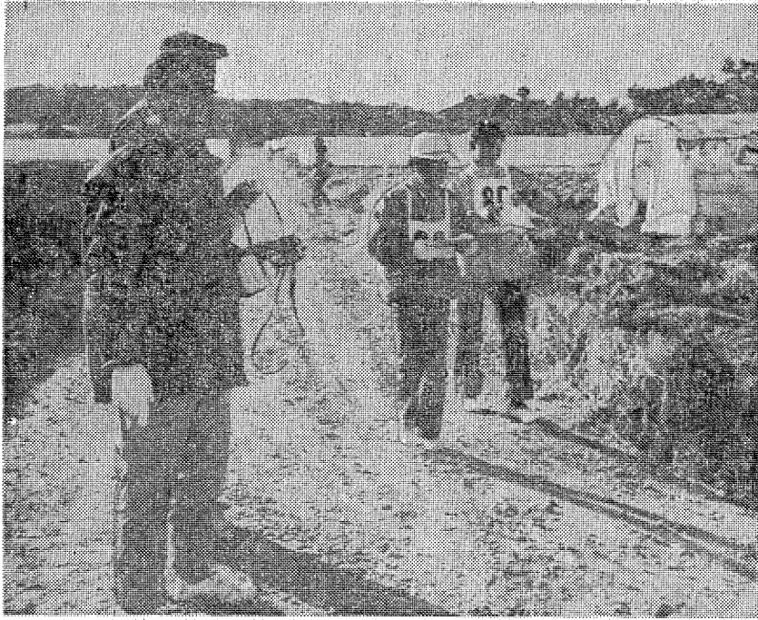
パトロール 子供のオリエンテーリングなので トランシーバーを持った指導員が迷いやすい地点において 迷った子供に正しい地図やコンパスの使い方を教え コースに戻している