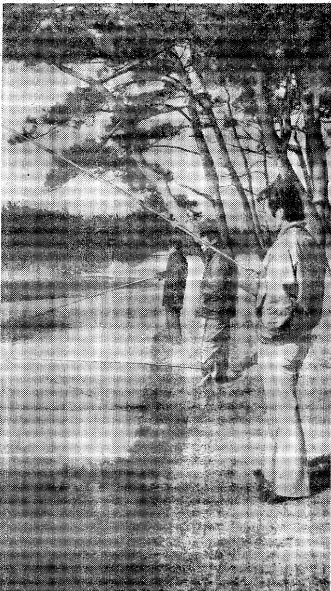
釣りを垂れる太公望