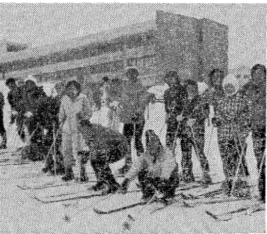
壁障青年の家スキー教室の農業後継者達