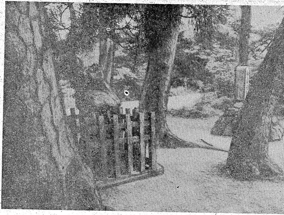
老木が立ち並ぶなかに山桜が... 勿来の関

● 勿来の南方二時ほど行った、丘原に、県立自然公園「勿来」の山桜が始まり、道中、● ● 今から約九百年前に、山桜が、● ● 八幡太郎義家が奥州征伐の、● ● 現在も奥州三戸(白河)から、● ● 眼下に広がる太平洋のなが