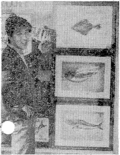
若人の翼の参加希望者募る

若人の翼の参加希望者を募ります。年齢は二十歳以上、二十五歳以下で、健康な若年者です。