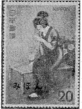
発売される大型切手