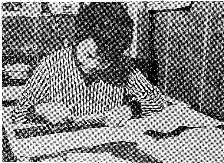
【電力値上げのハネ返りは家計簿】

電気料金はこのほど二十年ぶりに引き上げが決まり、本日から全国一斉に実施されることになりました。わたしたちの生活は、電気なくては生きていけない状態にあるだけに、家計に対するハネ返りが早くも心配されています。