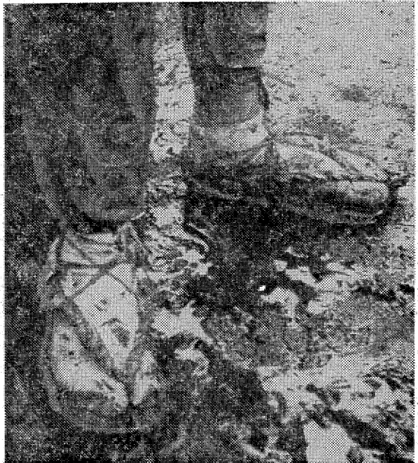
▲ 舞い終わって 山の土は雨に溶け、しし舞の白タビとワラジは茶色に染まった