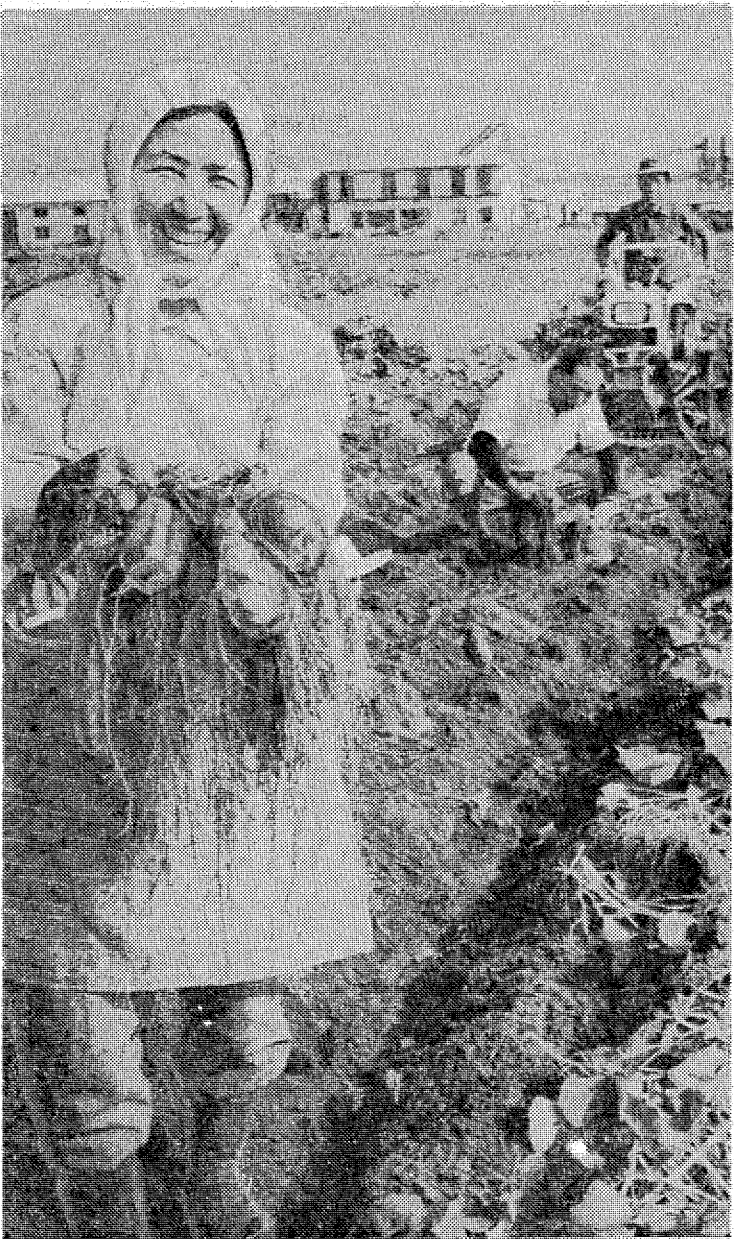
出荷が始まったサツマ芋掘り—四倉町細谷