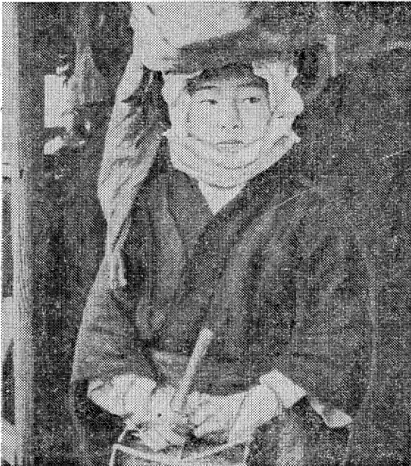
▲ 出発 身支度のすんだ少年は「世話人が推薦しただけあり、きりっとした美少年ぞろい」