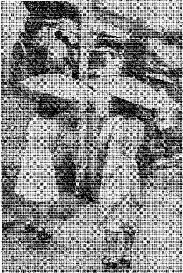
▲ 遠く離れて クライマックスの御山かけは女人禁制なので、女性は各所で行う「しし舞」。しか見物できず、それも離れて遠慮がち...