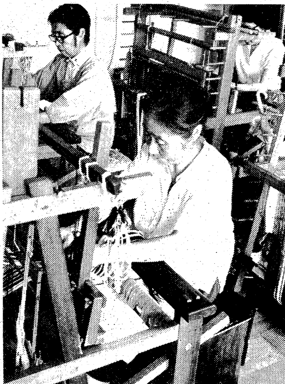
「はた織り機で作品をつくる至誠老人ホームのお年寄」

今年の四月二十日にオープンした東京・新宿の「陶美センター」という老人の手づくり作品を売る店が、いま、話題を集めています。その種の店として初めてのものであるというだけでなく、老人の自立を目指す方向性の一步として行われたので、その後わずか四か月の間に、全国的な反響を呼び起こしているのです。