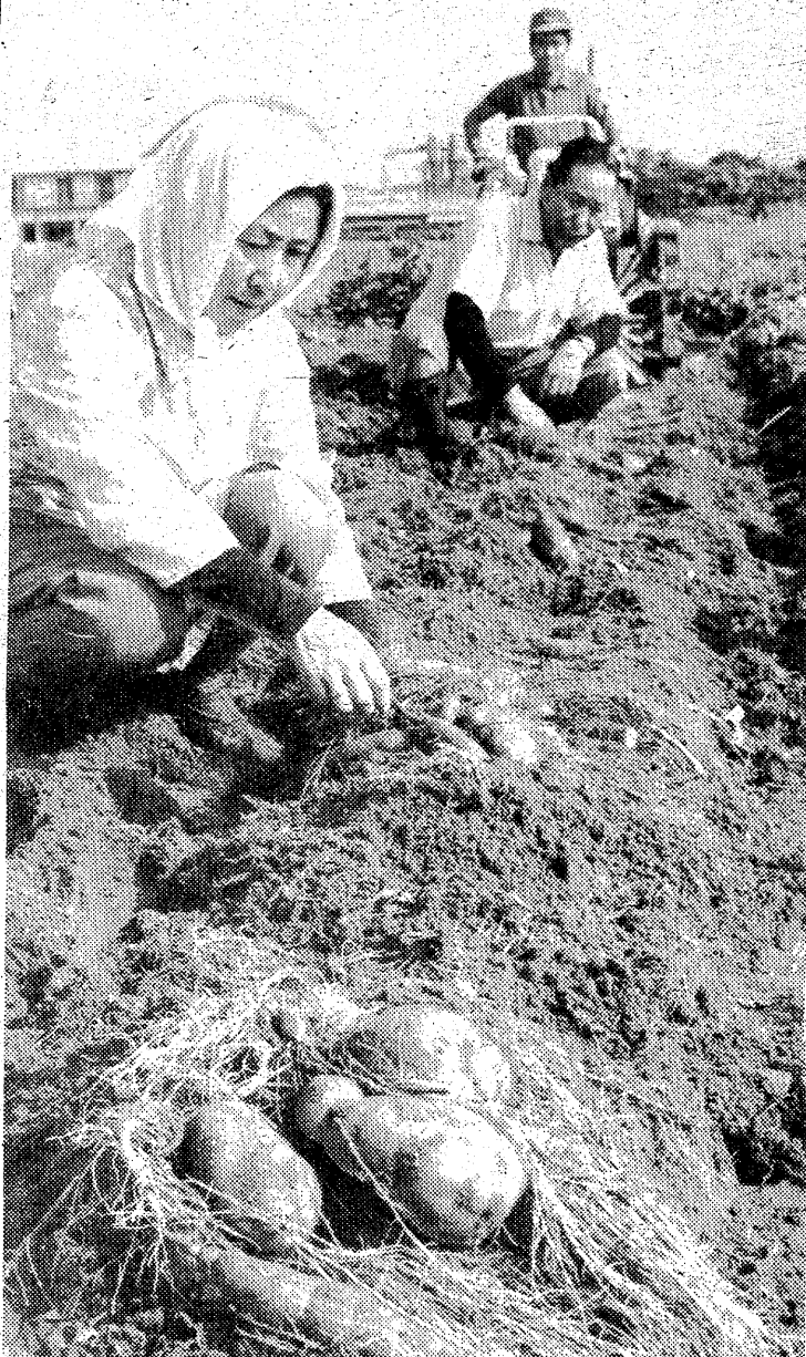
イモ掘り作業も機械化で—四倉・細谷地内—

いわき県税務所の場合、総合的に前年同期(自動車税を除く)より九億八千五百二十五万円増える