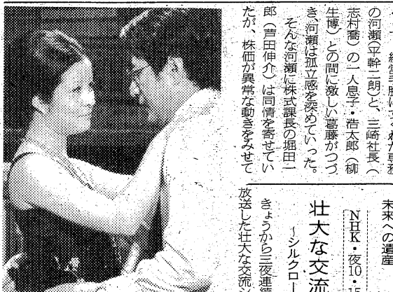
沖津教授夫人に誘惑され出世のためと計算づくでのめりこんでゆく克彦