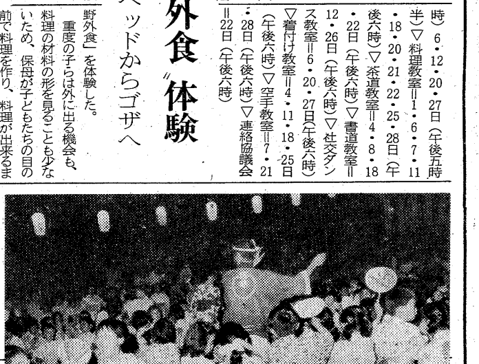
明徳館幼稚園の盆踊り

【福島警察療養園の野外食】 四倉地区 いわき市四倉支所 配と相談は、二十一日午前九時から午後三時まで、同支所にて配と相談を受け付ける。