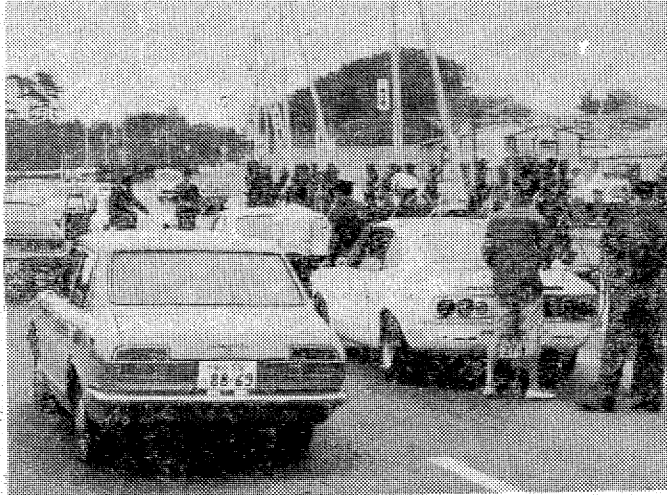
ボロナスサンデーの車を占う十五日は、公のボロナスサンデーは下見程度で、警部の異動交通機動隊第二方面いわき分駐隊、松崎強巡査(三) 山内市部高坂面分作二一 務員ボロナスの翌日、例年一回