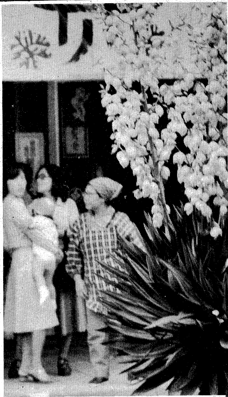
平大通りグリーンベルトに咲いたユッカランの花

五月の値上がり品目は、品薄で、四四%高の干ししいり、二〇%高の一日。二倍に八上がった干しいり、四〇%、たかんと激騰した砂糖落花生。安く上がったのは半値に落ちた大根のさつま芋、三三%高のリンゴ、ネル地、マッシュ、木炭の十品。根、キャベツにじゃが芋、アジ。