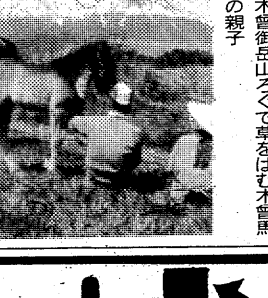
木曾岳山々を草をはむ木曾馬の親子