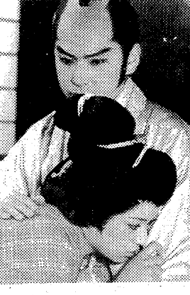
千鶴(ジュディ・オング)と吉透(志垣太郎)の純愛にかけりが...