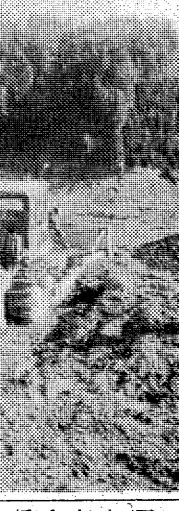
荒川運動公園の拡張工事現場

荒川運動公園の拡張が進んでいる。自衛隊が大規模な拡張工事を実施している。荒川運動公園の拡張が進んでいる。自衛隊が大規模な拡張工事を実施している。 荒川運動公園の拡張が進んでいる。自衛隊が大規模な拡張工事を実施している。荒川運動公園の拡張が進んでいる。自衛隊が大規模な拡張工事を実施している。