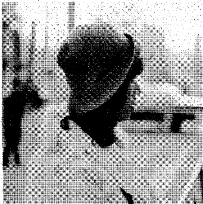
帽子ってかわいいですね。

むしろ小さくまとめて 今はミニやロングの時代ですから、頭は小さくまとめた全体がすべりむらむらとしたミニやロングになってしまっています。ミニの帽子などもミニな髪を包むようにして、逆だ、と、とても大きな帽子をかかってみるのもいいですが、やはり頭の高い人ではないと、この行進