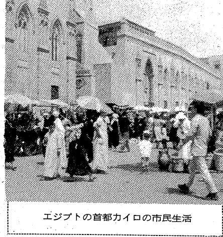
エジプトの首都カイロの市民生活