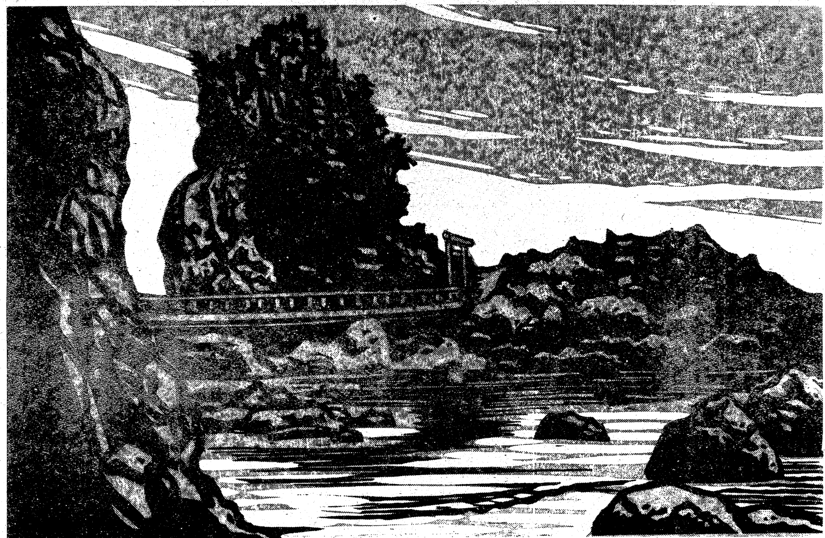
版画 坂本 勇 (日版会会員)