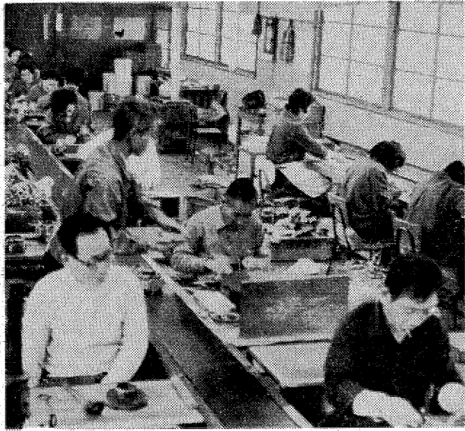
仕事が半分に減った内郷授産場