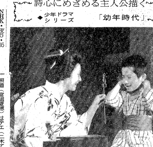
幼年期の成長を、大回連続 で描く。今週、来週は、母の 死の瞬間を描く。

ひまわりの詩 福島中央・夜9:00 福島(二浦友和)の父親職で 延びのびに育った雪花赤坂