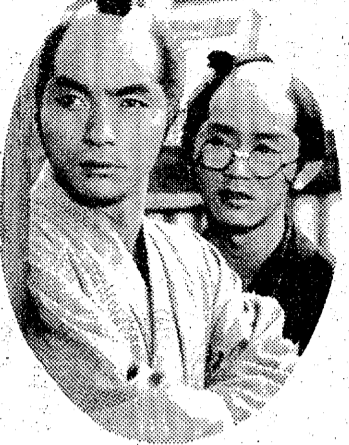
ねずみ小僧は次郎吉が足を洗 ったのちも生きていた