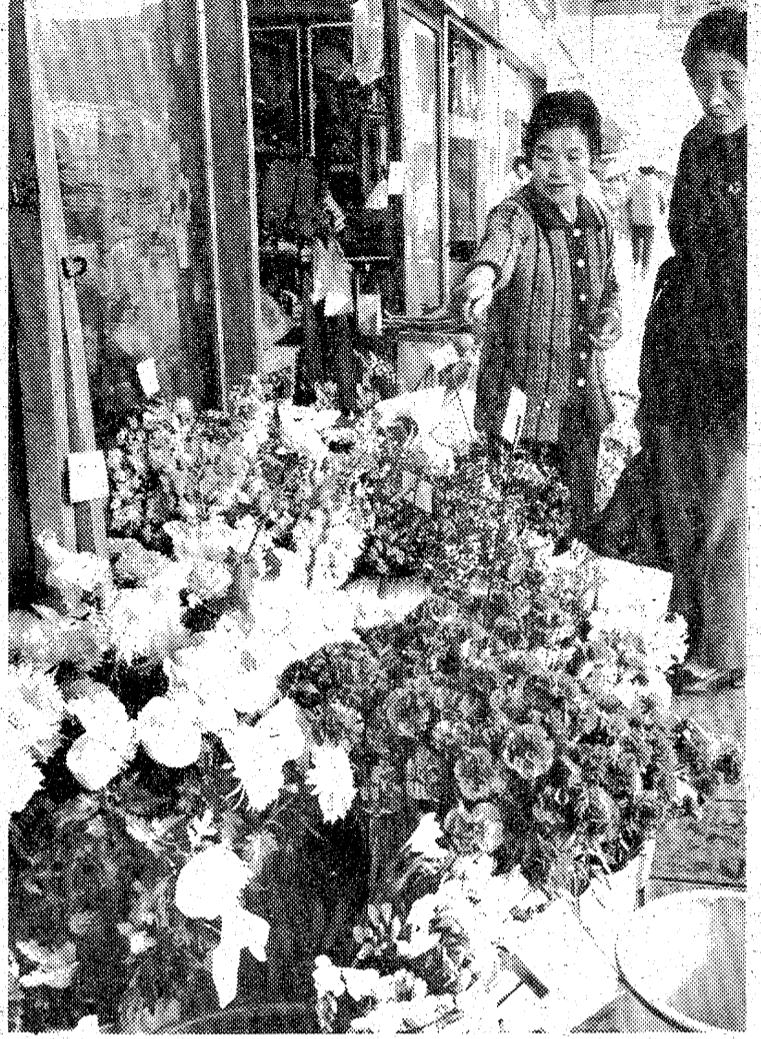
用途別の消費金額を見ると、市物などを求めた、いわゆる高切り一などを反映して、前年対比は 民が直接花屋を訪れ、切り花、鉢物が二億三千万円、生活の高度化、一〇%の増だった。市の花屋は

花きの需要は生活の高度化、趣味の多様化などを反映して伸びる一方、ビニールハウスの出現で町の花屋などには、年間を 通じて四季折々の切り花、鉢物などの花きが生産に置かれていないが、それでも需要は供給が追いつかないほどで、花きの値段も 急上昇。栽培農家は年々増えている。県いわき農政事務所はこのほど市民が昨年一年間に消費した花きの消費金額をまとめた が、それによると四億九千五百万円、前年対比では一〇%の増額。