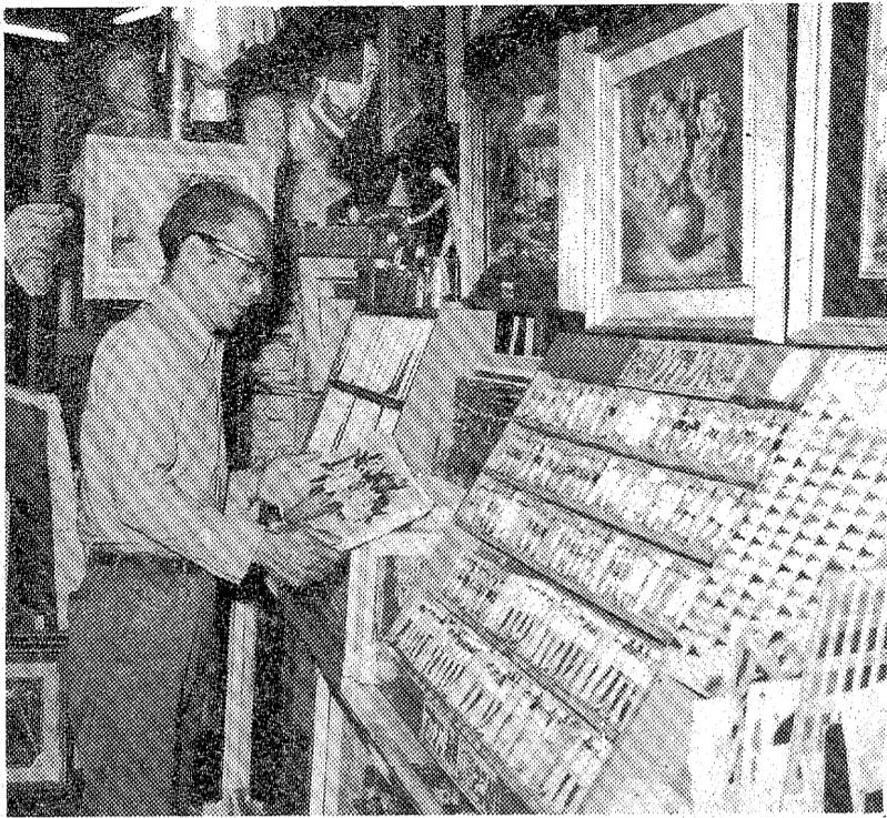
画材店内には写生用具が所狭しと並べられてある

秋の深まりとともに、山や溪谷の紅葉も一段と色が鮮やかになってきた。紅葉を求めて訪れる市民も日に多くなっているが、色を彩るばかりでなく、紅葉をハイク兼ねて訪れる市民も、最近、青森県や大宮市など、紅葉を求めて訪れる市民が、ハイキングを兼ねて写生会も盛況の多いものがある。また、秋の風情をスケッチする、水彩画を描くなど、ハイキングを兼ねて写生会も盛況の多いものがある。