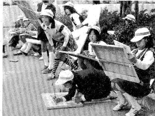
郊外で絵を描く子供たち

く、また、芸術の秋にふさわしい光景だ。 このほか、デパートの文房具売り場や画材店にはスケッチブック、画紙、絵の具などの画材を求めて訪れる人がこのごろ多くなり、飛ぶような売場を見せつけている。 あなたも、日曜画家になろうませんか。スケッチし、水彩画など、少々コツコツと描いてみるのは、いい気分転換になる。 「でも、下手だからなあ」とあきらめている人もいます。が、上手下手は二の次で、最初は自分の好きなものを、秋をキャンパスに、紙にスケッチする。 最初は、厚手の画用紙で大ききもの(二十五センチ×三十センチ)程度のもので描いてみるのがいい。値段は、二百円から四百円くらい。安いが、安いのは画用紙を使わずに、紙に描くのもいい。 まず、紙(厚手のスケッチブック)と、厚手の画用紙(大ききもの(二十五センチ×三十センチ)程度)を用意する。それらを実際(スケッチ)して描いてみる。描きかたは、スケッチを練習する。描きかたは、スケッチを練習する。