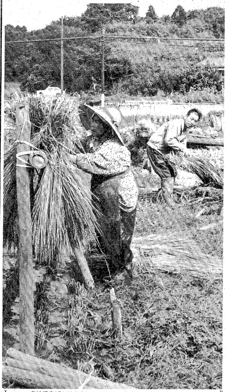
やけに空ばかり澄み切った被害水田でのハゼ木かけ＝田戸

夏の飲み物の中で王者を占めているビールも、しぜん冷夏の弊はなく、天候異常にあえなく取れた。いわき税務署が調べた、今夏六～八月のビール販売数量は三百四十九万二千七百八十八本の五百五十二万三千四百本(並大ピン)で、前年より五・四% (三十一万四千四百本) タウン、二十数年來初めての落ち込みだった。六、七月は連日な売れ行きだったが、八、夏祭りなど最高潮期の八月が低温曇雨で、ビール嗜好を減退させ、ガタ落ちとなった。