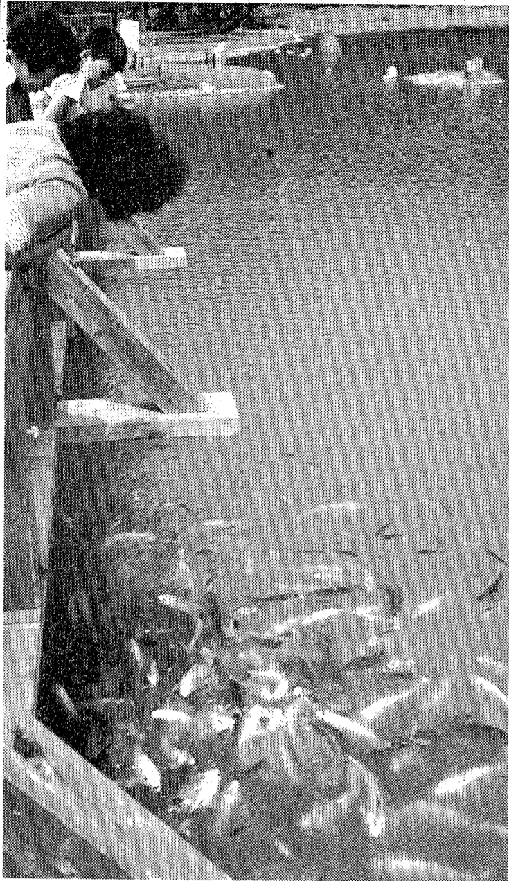
橋下に群がる色とりどりのニシキゴイ

平の南部と新島を隔てて隣接する平地区に入り込んだ、陸の海、家があつて、平たん部は一面の青の平地区は、丘陵地に沿って、山沿いに農田だった。