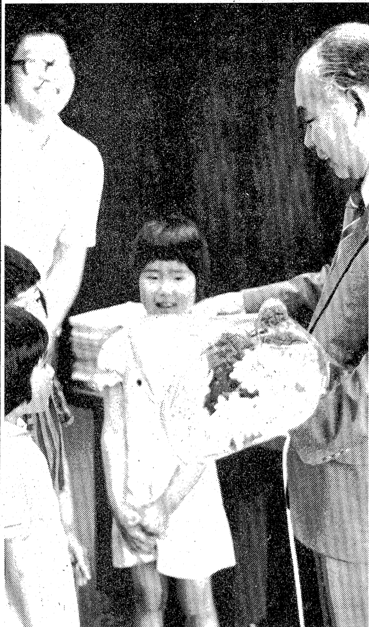
田畑市長に花束を贈り笑顔を交歓する園児たち

▽消費生活態度Ⅱ現在の消費者に次いで高く、消費生活を切り詰つて充実させたい二六・五%の層を維持した(三四・二%と郡山)めだいた三三・三%、生活上へも「暇、購買欲は旺盛高い」。