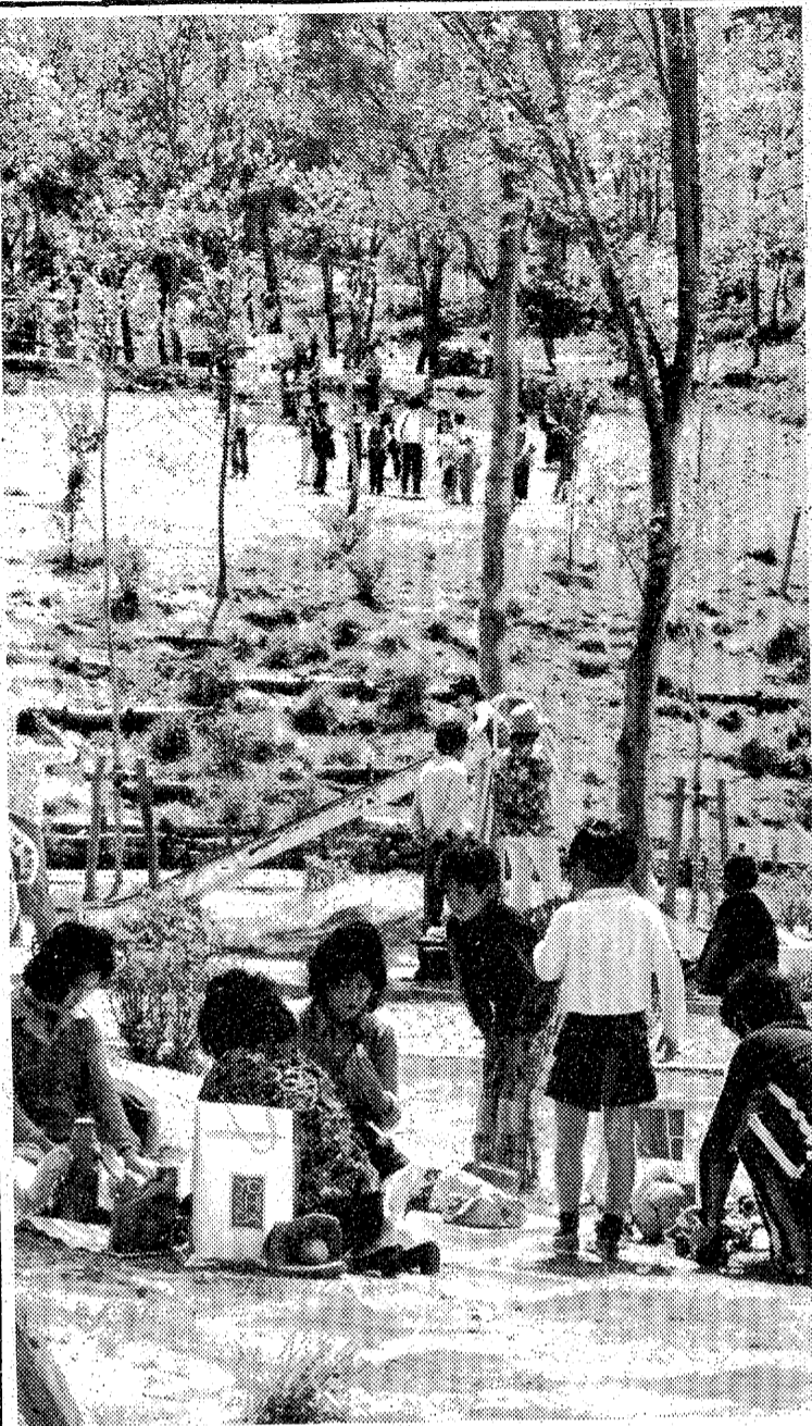
新舞子海岸を中心とし、平下高久から四倉町下仁井田まで約10kmの海岸には入り江もまばらなく、浸食が激しく、同海岸帯が闊か