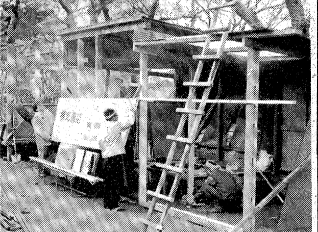
茶店に行列ができる日も間近

次週の催し。【天ホール】☆4日「すまみ風」の三連要史。【21ホール】☆4日「すまみ風」の三連要史。【21ホール】☆4日「すまみ風」の三連要史。