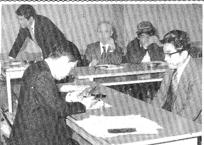
川前支所でのパスポート申請受付の様子

不況、節約生活なんのそのと、多岐をしなければならぬ。この最近の海外旅行ブームは、全市民の間から、市内で手続きの簡便化が求められ、いわき市でも多岐にも、海外旅行希望者は増える一方、いわき市合同庁舎で出張による初回のパスポート申請受付が行われ、海外旅行に必要なのは、パスポートの申請受付を行う。