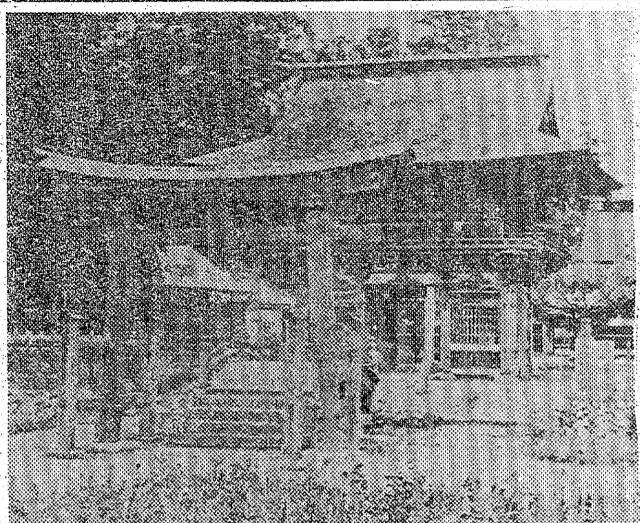
改装前の八幡宮の入り口