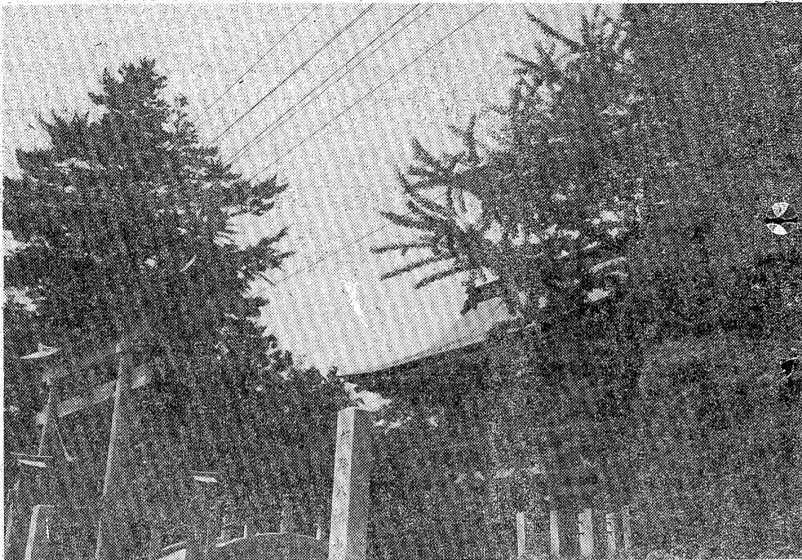
現在の飯野八幡宮の入り口