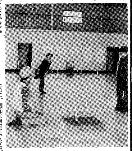
輪投げも楽しめまーす

これは難しい縄(じし) 上では難しさを覚える。大半の人は「五回ほど」と思っていたが、いかに体力が衰えているのか、一回も通らない。 (記事本文)