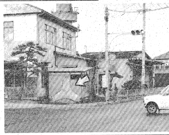
「テトラポット」を並べ、防車対策を講じた。

警署 度重なる事故に自衛 「テトラポット」を並べ、防車対策を講じた。度重なる事故に自衛するため、警署は「テトラポット」を並べ、防車対策を講じた。