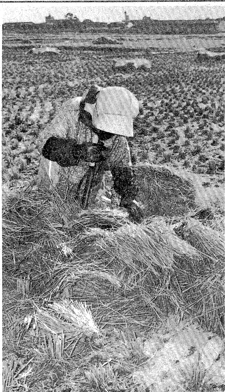
押し切り器でワラをきぎむ農家の主婦