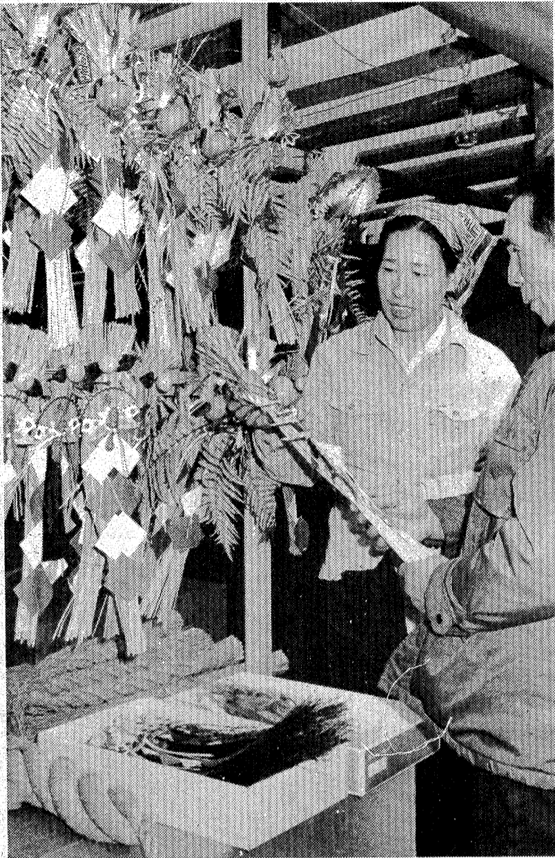
この方が歳神さまに目立つかじら＝平・白銀通り