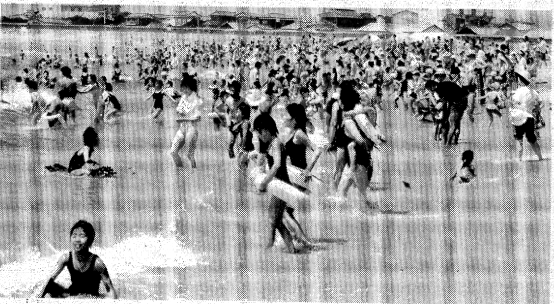
この海水浴場も潮流と築港の関係で砂浜が狭くなったこともある — 今はシーズン 大にぎわいである